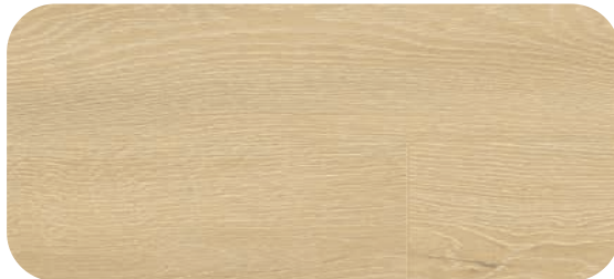
V4V872 CHALK OAK