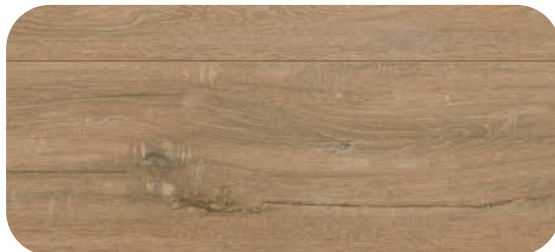
BYPVIW00533 IPANEMA OAK