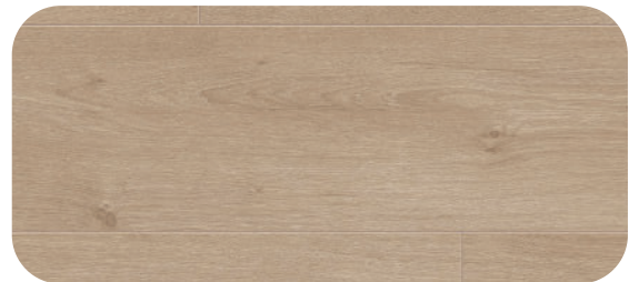
V4V605 MORAINE NATURAL OAK