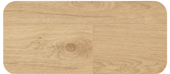
V4V799 SPRING OAK