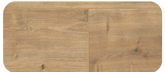
V4V436 TAYLOR OAK