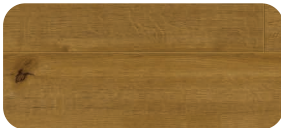
V4V780 PHOENIX OAK